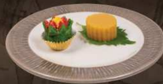
宮廷豌豆黃 | 富貴牡丹酥